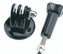
Tripodhalter mit Schraube

Die Lieferung erfolgt ohne Kamera, Gehäuse, Smartphone und Stativ.