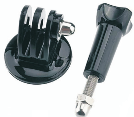
Tripodhalter mit Daumenschraube