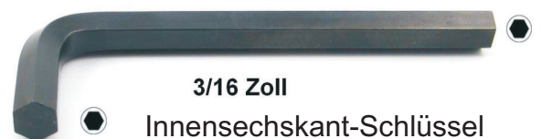
3/16 Zoll Innensechskant-Schlüssel